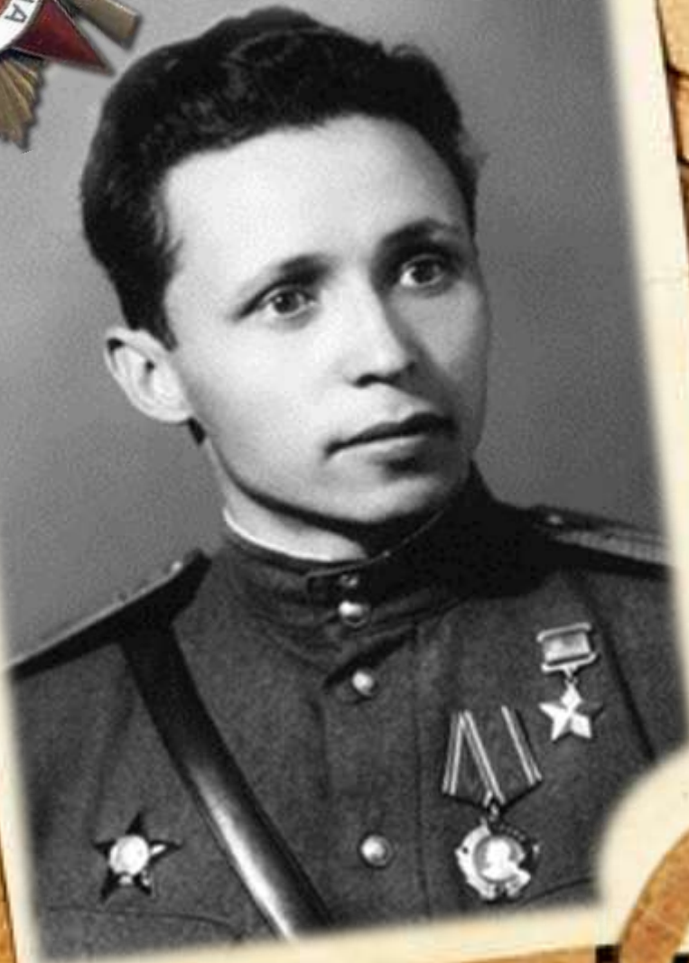
Московченко Григорий Савельевич (1916—1995)

Начальник разведки 320-го гвардейского миномётного дивизиона 67-го гвардейского миномётного полка Южного фронта, гвардии лейтенант.